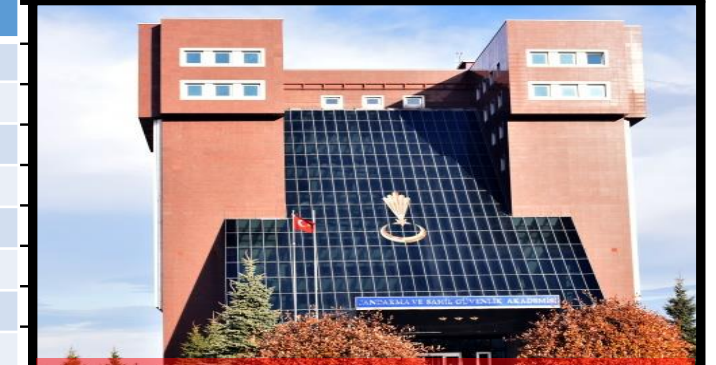
Jandarma ve Sahil Güvenlik Akademisi(2016)